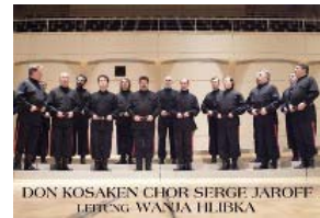
Don Kosaken Chor Serge Jaroff